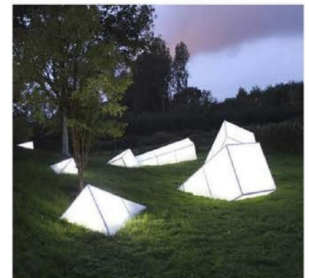
Alejandro Sanchez Suarez > Colombie

Le dossier de candidature doit être fourni (envoyé par courrier électronique) au moins 2 mois avant la période souhaitée : lamaisonverte@jardin-botanique.org .